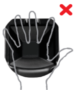
Пальцы на сканере