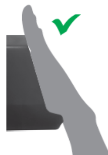
Ровно и плотно